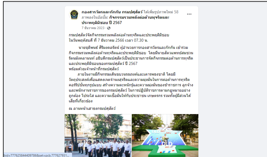
Facebook กองสารวัตร