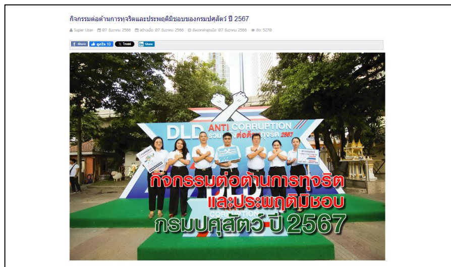
เว็บไซต์กองสารวัตร

๓. ตรวจสอบข้อร้องเรียนจากผู้ร้องเรียนผ่านทุกช่องทางของกรมศุลกากรอย่างเข้มงวด อาทิ dld ๔.๐, Facebook แฟนเพจ, จดหมายอิเล็กทรอนิกส์, โทรศัพท์เป็นต้น และลงโทษทางวินัยอย่างเคร่งครัด ปีงบประมาณ ๒๕๖๗ (๑ ตุลาคม ๒๕๖๖ – ๓๐ กันยายน ๒๕๖๗) พบว่าไม่มีรายการร้องเรียนการทุจริตของเจ้าหน้าที่กองสารวัตรและกักกัน