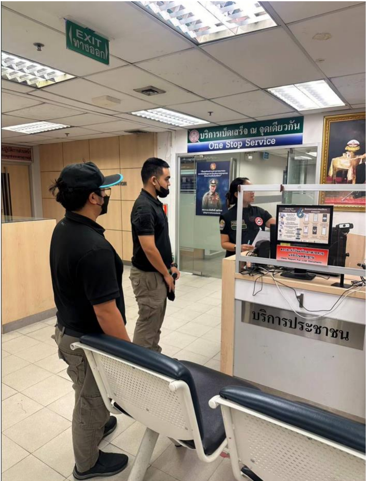
ภาพผนวก 11 เสร็จสิ้นขั้นตอนการร้องทุกข์กล่าวโทษ