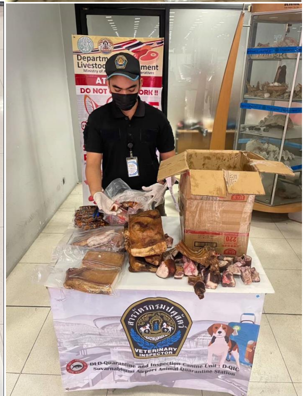
ภาพผนวก 1 เมื่อพบการกระทำผิดซึ่งหน้า