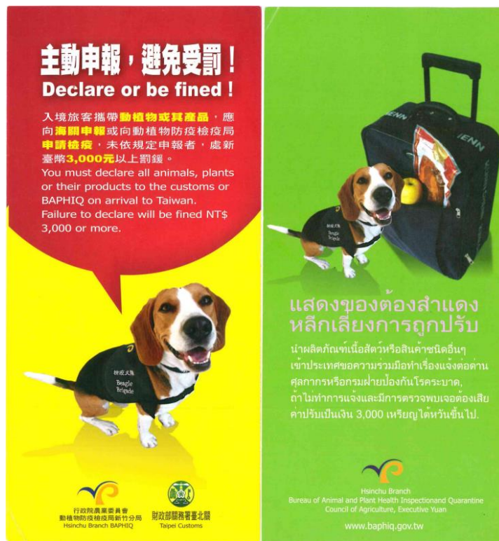
ภาพที่ 2 แผ่นพับประชาสัมพันธ์กฎหมายควบคุมการนำเข้าเนื้อสัตว์และผลิตภัณฑ์จากเนื้อสัตว์ของประเทศไต้หวัน (BAPHIQ, 2023)