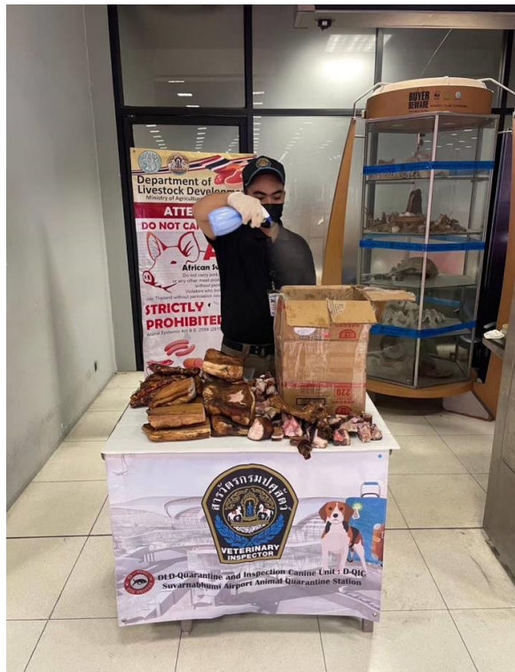
ภาพผนวก 3 ทำการพ่นน้ำยาฆ่าเชื้อเพื่อทำลายเชื้อโรคเบื้องต้น